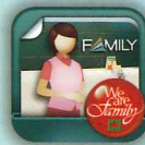
中國信託行動銀行 Home Bank